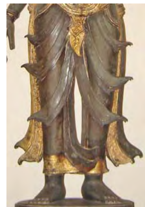
รูปที่ 111 ชายผ้ารุงรูปพระลักษมี

การพบความนิยมในการสร้างประติมากรรมรูปฤาษีร่วมกับเทวรูปฮินดู อาจเป็นการแสดงให้เห็นถึงความสำคัญและอิทธิพลของกลุ่มนักบวชฮินดูหรือพราหมณ์ที่ได้รับการอุปถัมภ์เป็นอย่างดีจากพระมหากษัตริย์ และน่าจะเป็นสาเหตุหนึ่งที่ทำให้ศาสนาฮินดูมีบทบาทอยู่ในสมัยกรุงศรีอยุธยาหลายด้านๆ เช่น ศิลปกรรม วรรณกรรม วัฒนธรรม ประเพณี ความเชื่อ ที่สืบทอดต่อมาจนถึงสมัยรัตนโกสินทร์