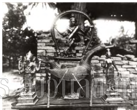
รูปที่ 113 ภาพถ่ายเก่าแสดงการประดิษฐานรูปเคารพประธานภายในสถานพระอิศวร

นอกเหนือจากการเป็นหลักฐานด้านเอกสารที่ให้ข้อมูลเกี่ยวกับศาสนาฮินดูในเมืองนครศรีธรรมราชสมัยกรุงศรีอยุธยาแล้ว ยังกล่าวถึงหลักฐานด้านโบราณคดีเช่นกัน โดยเนื้อหาในตำนานพราหมณ์เมืองนครศรีธรรมราชกล่าวว่า กษัตริย์จากอินเดียได้พระองค์หนึ่งได้ส่งเทวรูปพร้อมพราหมณ์มาถวายให้พระรามาธิบดี แต่เนื่องจากเกิดมีพายุทำให้ไม่สามารถออกเดินทางจากนครศรีธรรมราชไปยังราชธานีอยุธยาได้ พราหมณ์จึงทำนายว่าเทวรูปอยากประดิษฐานอยู่ ณ เมืองนครศรีธรรมราชนี้ พระองค์จึงทรงมีรับสั่งให้สร้างโบสถ์พราหมณ์สำหรับประดิษฐานเทวรูป