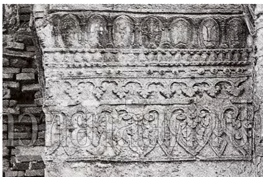
รูปที่ 109 ลายเฟื้องอุบะที่ปราสาทพระศรีวิตรัตนมหาธาตุ วัดพระศรีวิตรัตนมหาธาตุ จังหวัดสุพรรณบุรี ศิลปะอยุธยาตอนต้น

โดยที่ได้พบลวดลายปูนปั้นที่คล้ายกับลายเฟื้องอุบะ - ลายกรวยเชิงในปราสาทวัดจุฬามณีที่สถาปนาโดยสมเด็จพระบรมไตรโลกนาถ 8 (รูปที่ 109-110) จึงอาจเป็นไปได้ว่ามหาจักรพรรดิผู้พ่อและผู้ลูกที่ในจารึกกล่าวถึง คือสมเด็จพระบรมราชาธิราชที่ 2 และสมเด็จพระบรมไตรโลกนาถ และรูปพระอิศวรสำริดขนาดเล็กในกลุ่มอิทธิพลศิลปะเขมร-ศิลปะสุโขทัย ก็น่าจะสร้างขึ้นในช่วงเวลาเดียวกันนี้