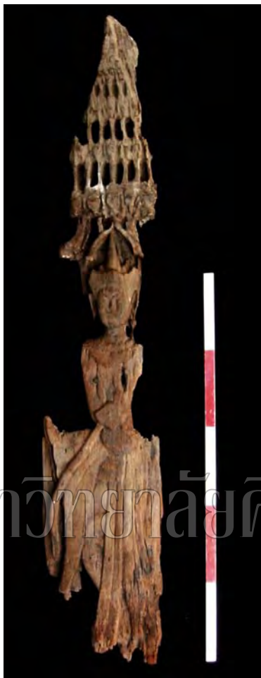
รูปที่ 116 นางกระดาน หรือนางดาน

หัวเมืองปักษ์ใต้ว่ามีรูปพระนารายณ์หนึ่งองค์ สร้างด้วยปูนและมีรูปแบบศิลปะแบบศิลปะอยุธยา และมีครุฑหินอีกหนึ่งองค์ 24