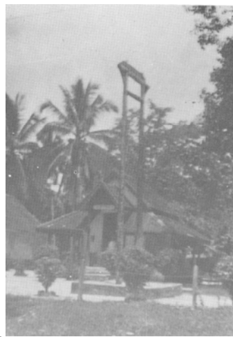
รูปที่ 114 เสาชิงช้าหน้าโบสถ์พราหมณ์ จังหวัด นครศรีธรรมราช

การประดิษฐานพระศิวนาฏราชที่มีพระอุมาประทับยืนอยู่ทางด้านซ้ายเช่นนี้มีระบุไว้ใน คัมภีร์ไศวาคมะ (Śaivāgamas) เป็นที่นิยมในวัดที่เป็น ของไศวนิกายโดยเฉพาะอย่างยิ่งในอินเดียภาคใต้ซึ่งมี สถานที่ที่อุทิศให้กับพระศิวะในรูปแบบนี้โดยเฉพาะ เรียกว่า “นาฏนาสabah” (Naṭana-Sabhā) รูปพระอุมาจะทรง ประทับยืนตรึงค์ พระหัตถ์ขวายกขึ้นระดับพระอุระในท่า กนกมุทรา พระหัตถ์ซ้ายปล่อยลงข้างพระวรกาย 19 ลักษณะเดียวกับที่ปรากฏในประติมากรรมรูปพระอุมา องค์ดังกล่าว