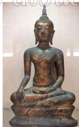
รูปที่ 108 พระพุทธรูปปางมารวิชัยแบบอุททองรุ่นที่ 3 จัดแสดงในพิพิธภัณฑสถานแห่งชาติพระนคร

นอกจากนั้นยังพบความคล้ายคลึงกันในส่วนของลวดลายประดับที่ใช้ในงานประดับสถาปัตยกรรม ซึ่งเป็นอย่างเดียวกับที่พบอยู่ในรูปพระอิศวรประทับยืน (ดูรูปที่ 3) กล่าวคือ เป็น