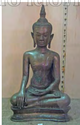
รูปที่ 107 พระพุทธรูปปางมารวิชัยแบบอุททองรุ่นที่ 2 จัดแสดงในพิพิธภัณฑสถานแห่งชาติพระนคร

จากการวิเคราะห์งานศิลปกรรมเห็นได้ว่ารูปแบบศิลปะของรูปเคารพเนื่องในศาสนาฮินดูระยะต้นนั้น คือ ประติมากรรมกลุ่มที่สร้างขึ้นในราวปลายพุทธศตวรรษที่ 20-ต้นพุทธศตวรรษที่ 21 และมีอิทธิพลศิลปะเขมรและศิลปะสุโขทัย มีความสอดคล้องกับพัฒนาการทางด้านรูปแบบศิลปะของพระพุทธรูปที่สร้างขึ้นในช่วงพุทธศตวรรษที่ 20-21 ซึ่งมีการผสมผสานระหว่างศิลปะเขมรและศิลปะสุโขทัยที่นิยมเรียกว่าพระพุทธรูปแบบอุททองรุ่นที่ 2 และพระพุทธรูปแบบอุททองรุ่นที่ 3 โดยรุ่นที่ 3 นั้นมีลักษณะของศิลปะสุโขทัยมากกว่าศิลปะเขมรแล้ว และเป็นแบบที่พบมากที่สุดจากพระพุทธรูปที่พบในกรุพระปรางค์วัดราชบูรณะที่สร้างโดยสมเด็จพระเจ้าพระยา และนิยมถึงรัชกาลต่อมา 6 ดังนั้นเทวรูปกลุ่มที่แสดงอิทธิพลศิลปะเขมร-ศิลปะสุโขทัย ก็น่าที่จะสร้างขึ้นในรุ่นราวคราวเดียวกันนี้พระพุทธรูปแบบอุททอง รุ่นที่ 2 และรุ่นที่ 3 (รูปที่ 107-108)