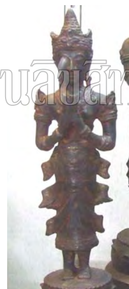
รูปที่ 112 เทพนม ศิลปะล้านนา จัดแสดงในพิพิธภัณฑสถานแห่งชาติพระนคร