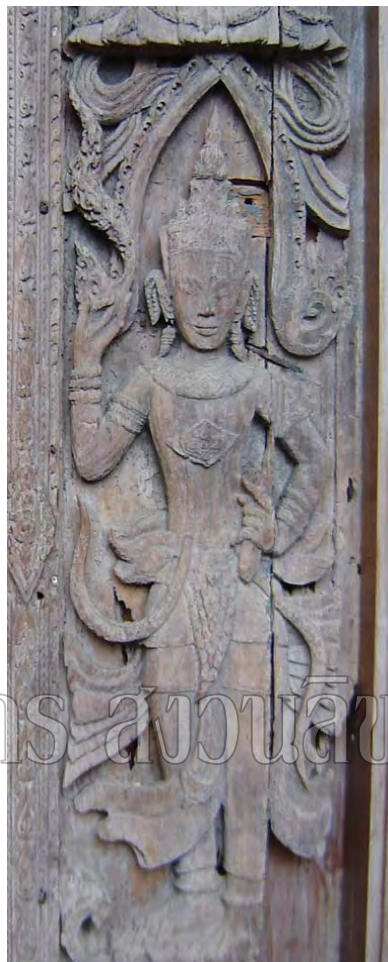
รูปที่ 117 ทวารบาลสลักบนบานประตูไม้จากซุ้มจะนำเจดีย์วัดพระศรี สรรเพชญ์ ศิลปะอยุธยา จัดแสดงในพิพิธภัณฑสถานแห่งชาติ เจ้าสามพระยา

พราหมณ์เมืองนครศรีธรรมราชและพราหมณ์ที่อยู่ในเกาะเมืองอยุธยาน่าจะมีความสัมพันธ์ในระดับที่แน่นแฟ้น เนื่องจากเมื่อคราวเสียกรุงศรีอยุธยาแก่พม่า กล่าวกันว่าครั้งนั้นมีชาวพระนครศรีอยุธยา ทั้งข้าราชการพระสงฆ์รวมทั้งพราหมณ์อพยพหนีไปอยู่เมืองนครศรีธรรมราชเป็นจำนวนมาก 25 ดังนั้นพราหมณ์และศาสนาฮินดูจากเมืองนครศรีธรรมราชจึงสืบ