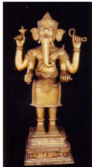
รูปที่ 115 พระพิฆเนศวรจากโบสถ์พราหมณ์ เมืองนครศรีธรรมราช ปัจจุบันจัดแสดงที่พิพิธภัณฑสถานแห่งชาติ นครศรีธรรมราช

นอกจากนี้ภายในโบสถ์พราหมณ์ ยังพบไม้กระดานแกะสลักเป็นรูปเทวสตรี เรียกกันว่านางกระดานหรือนางดาน ตามที่สมเด็จพระยานวิศรานุวัตติวงศ์ทรงบันทึกไว้ว่าพบอยู่ 4 แผ่น แต่ปัจจุบันเหลือให้เห็นเพียงรูปเดียว (รูปที่ 116) เข้าใจกันว่าเป็นรูปพระแม่คงคาหรืออาจเป็นพระแม่ธรณี 22 กระดานนี้ใช้ในพิธีกระดานลงหลุมจัดขึ้นในวันขึ้นแปดค่ำ เวลาเช้ามีดในช่วงประกอบพระราชพิธีตรียัมปวาย ใช้กระดานสามแผ่นสลักเป็นรูปพระอาทิตย์ พระจันทร์หนึ่งแผ่น รูปพระคงคาและรูปพระแม่ธรณีองค์ละหนึ่งแผ่น พิธีจะกระทำกันเป็นเวลาหนึ่งวันเต็มเสร็จสิ้นในเวลาฟ้าสางของวันขึ้นเก้าค่ำซึ่งเป็นวันแห่ กระดานนี้จะอยู่ในหลุมเป็นเวลาสามวันถึงเช้าของวันขึ้นสิบสองค่ำจึงเชิญกระดานไปเก็บไว้ในเทวสถานตามเดิม 23