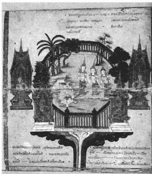
รูปที่ 4 อุทยานจิตรลดาวัน อยู่ในสวรรค์ชั้นดาวดึงส์ (จากสมุดภาพไตรภูมิโบราณ ฉบับกรุงธนบุรี)