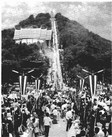
รูปที่ 6 งานดักบาตรเทโว ที่จังหวัดอุทัยธานี มีแถวพระสงฆ์เดินลงบันไดมารับบาตรที่เชิงเขา เป็นการจำลองภาพ “เสด็จลงมาจากสวรรค์ชั้นดาวดึงส์”