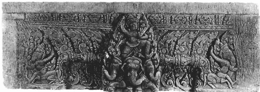
รูปที่ 2 พระอินทร์ทรงช้างเอราวัณ ทับหลัง (ศิลา) พบที่ปราสาทหินเมืองแขก อำเภอสูงเนินจังหวัดนครราชสีมา อายุราวพุทธศตวรรษที่ 15 (ปัจจุบันอยู่ในพิพิธภัณฑสถานแห่งชาติพิมาย)