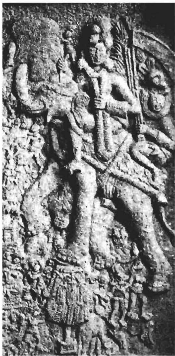
รูปที่ 1 ภาพสลักบนระเบียงของวิหารหมายเลข 19 ที่ ถ้ำภาษาแคว้นมหาราษฎร์ (อินเดียภาคตะวันตกเฉียงใต้) แสดงภาพพระอินทร์ทรงช้างเอราวัณ (พระอินทร์เป็นหัวหน้าเทวดาบนสวรรค์ชั้นดาวดึงส์) ศิลปะอินเดียโบราณ อายุราวพุทธศตวรรษที่ 5