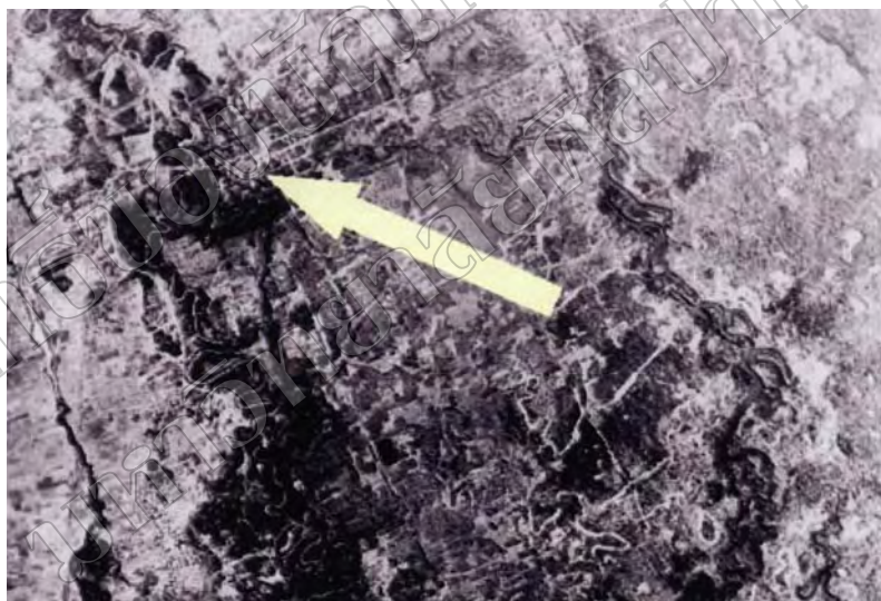
ภาพที่ 4 ภาพถ่ายทางอากาศแสดงที่ตั้งเมืองพิมาย

เมืองพิมายตั้งอยู่ระหว่างเส้นรุ้งที่ 15 องศา 13 ลิปดา เหนือ และเส้นแวงที่ 102 องศา 30 ลิปดา ตะวันออก ซึ่งบริเวณที่ตั้งของเมืองพิมายมีลักษณะภูมิประเทศเป็นที่ราบลุ่มมีแม่น้ำหลายสายไหลโอบล้อม (ภาพที่ 4) คือ ทางด้านตะวันตกมีแม่น้ำมูลไหลโอบไปทางทิศเหนือและทิศตะวันออก ทางด้านใต้มีลำน้ำจักรราชไหลไปทางทิศตะวันตกและมีสาขาชื่อลำน้ำเค็มไหลผ่านทำนงสระผมทางด้านใต้ของเมืองพิมายไปบรรจบกับแม่น้ำมูล