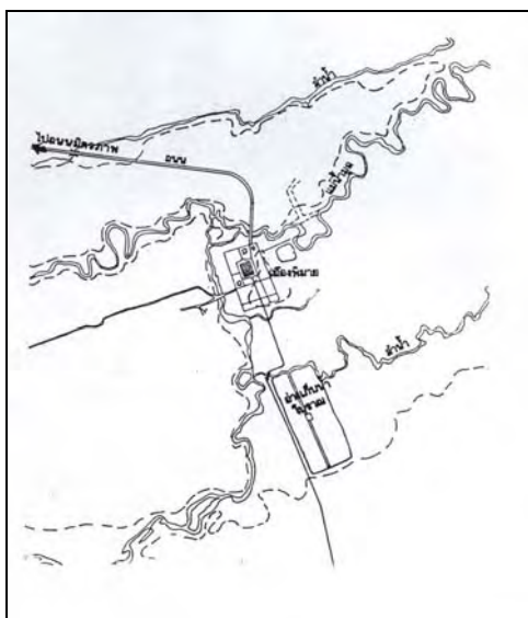
ภาพที่ 6 แสดงแม่น้ำลำคลองที่ไหลล้อมรอบและผ่านเมืองพิมาย

จากลักษณะดังกล่าว ประกอบกับบริเวณที่ราบสูงโคราชเป็นพื้นที่ลำน้ำสาขาหลายสายของแม่น้ำมูล ทำให้บริเวณนี้มีความอุดมสมบูรณ์เหมาะแก่การตั้งถิ่นฐานและการเกษตรกรรม โดยเฉพาะในเขตต้นน้ำทางด้านตะวันตก เช่น ลำเชิงไกร ลำธารปราสาท ลำจักรราช (ภาพที่ 6) ซึ่งในบริเวณนี้มีการศึกษาพบหลักฐานเครื่องมือเครื่องใช้และร่องรอยการอยู่อาศัยของมนุษย์มาตั้งแต่สมัยก่อนประวัติศาสตร์ตอนปลายหรือช่วงยุคเหล็ก 44 อีกทั้งที่เมืองพิมายเองก็มีการขุดพบเศษภาชนะดินเผาสีดำนับล้านชิ้นลาย หรือที่เรียกกันว่า ภาชนะดินเผาแบบพิมายดำกระจายอยู่ทั่วเมือง 45 ซึ่งศรีศักร วัลลิโภดม แสดงความเห็นว่ามีอายุประมาณพุทธศตวรรษที่ 8 46 (ประมาณคริสต์ศตวรรษที่ 2 ถึงกลางคริสต์ศตวรรษที่ 3)