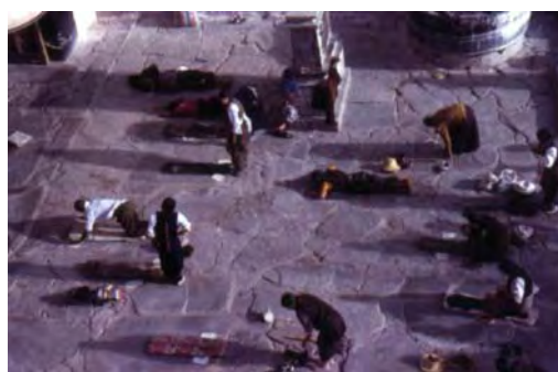
ภาพที่ 8 การทำอักษฎางคประดิษฐ์ในลัทธิวัชรยานที่ประเทศทิเบตและเนปาลปัจจุบัน

ลัทธิวัชรยานเริ่มปรากฏในเขมรมาตั้งแต่สมัยพระเจ้าราเชนทรวรมัน (พ.ศ. 1474 – 1511 หรือ ค.ศ. 935 – 968) เพราะจารึกปราสาทเบ็งเวียนได้กล่าวถึงพระโลเกศวรและนางปรัชญาปารมิตา ผู้ประทานกำเนิดพระชินพุทธะและธาตุทั้ง 5 (มูลปรุกฤติ) ในไตรโลก 78 นอกจากนี้จารึกบ้านสับบาก อำเภอบักธงชัย จังหวัดนครราชสีมา ใน พ.ศ. 1609 (ค.ศ. 1066) ได้กล่าวถึงพระปาณจุสศุต 79 ซึ่งคือ พระชินพุทธะในลัทธิวัชรยาน และยังกล่าวถึงคัมภีร์ศรีสมาจะ 80 ซึ่งเป็นชื่อย่อของคัมภีร์ศรีคุหยสมาดันตระ (การสนทนาที่เป็นความลับ) เป็นคัมภีร์เก่าสุดที่พระพุทธเจ้า