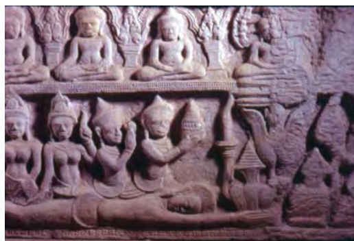
ภาพที่ 7 ทับหลังประดับประตูปะตูแสดงภาพอักษฎางคประดิษฐ์